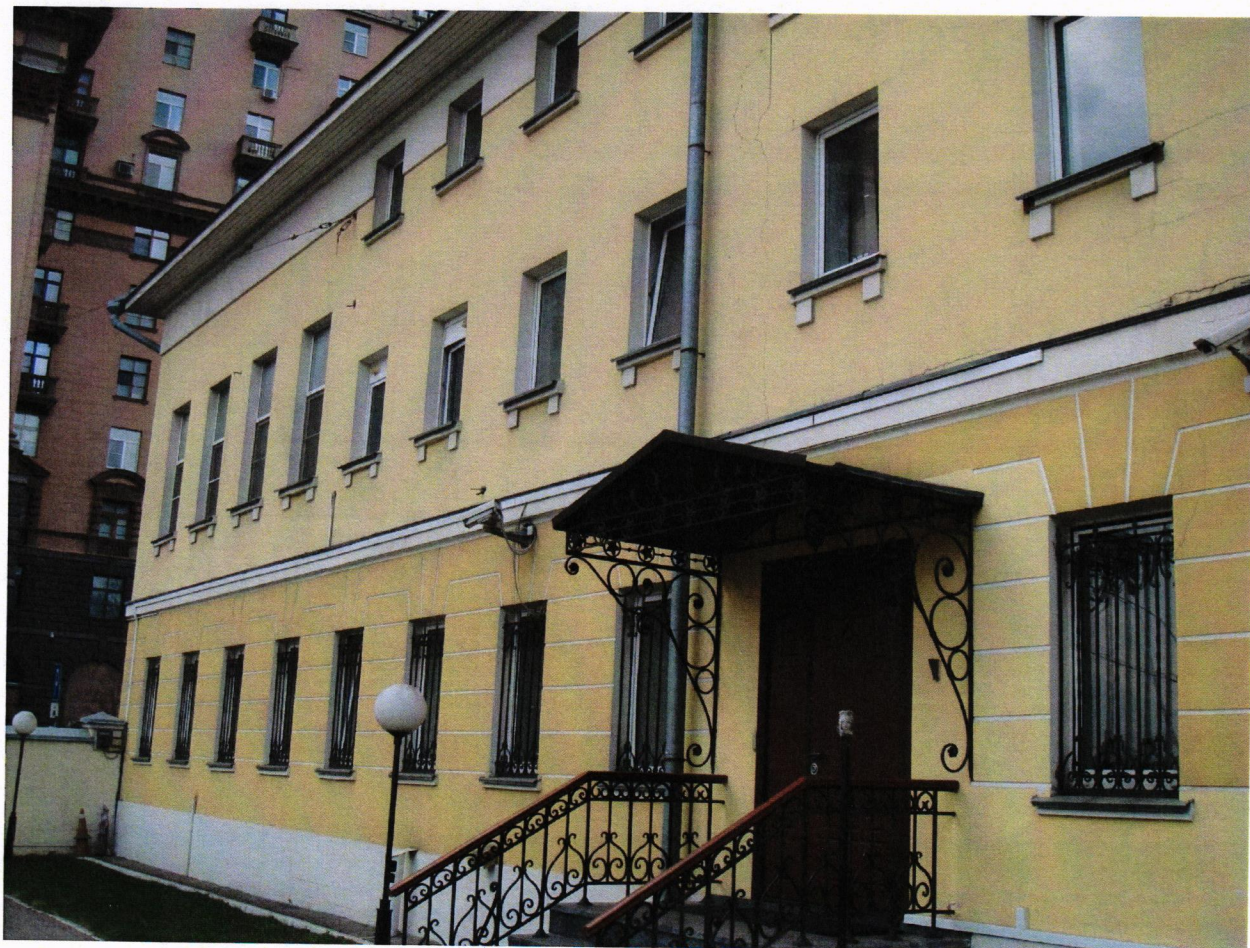
Фото № 4. Входная группа южного фасада со стороны внутреннего двора.