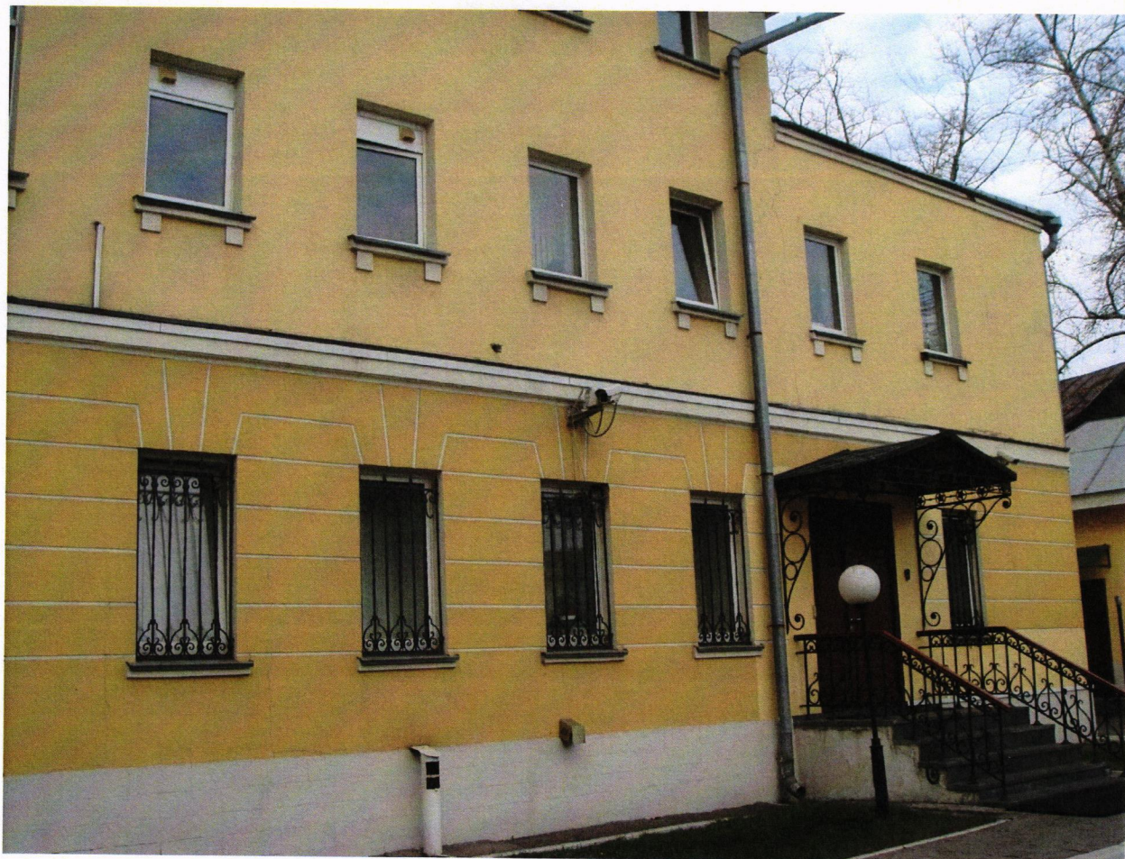
Фото № 3. Южный фасад, вид со стороны двора.