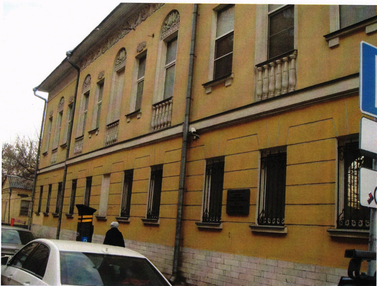
Фото № 1. Главный фасад по красной линии Гончарной улицы.